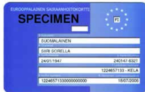
Kuva: Eurooppalainen sairaanhoitokortti

www.kela.fi/eurooppalainen-sairaanhoitokortti